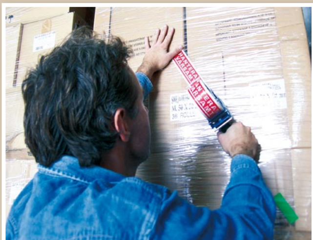
Packtejp, med och utan tryck