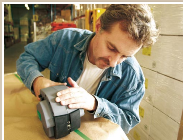
Band och bandtillbehör